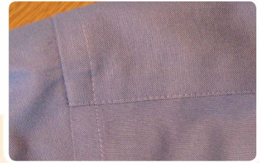
成衣手感更好质量更持久

如果您正在寻找一种能增加成衣品质并且更耐用的缝接胶条, UltiSeam 热熔性缝接产品系列定让您满意。