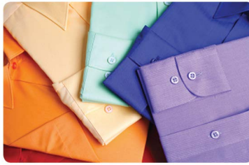
缝接平服不起皱褶